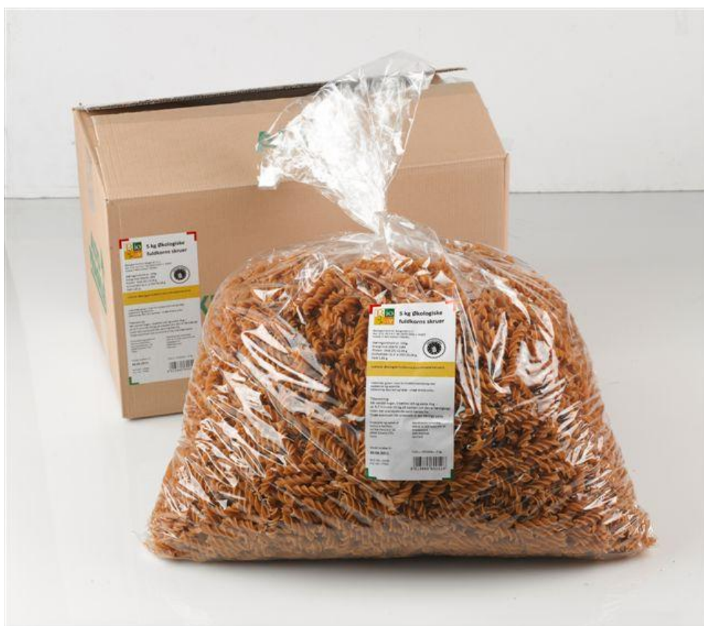
Fusilli fuldkorn (nr. 90930)