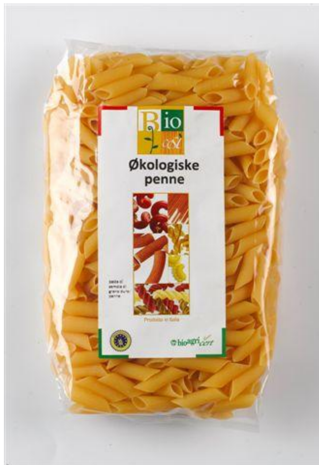
Penne durum (nr. 90935)