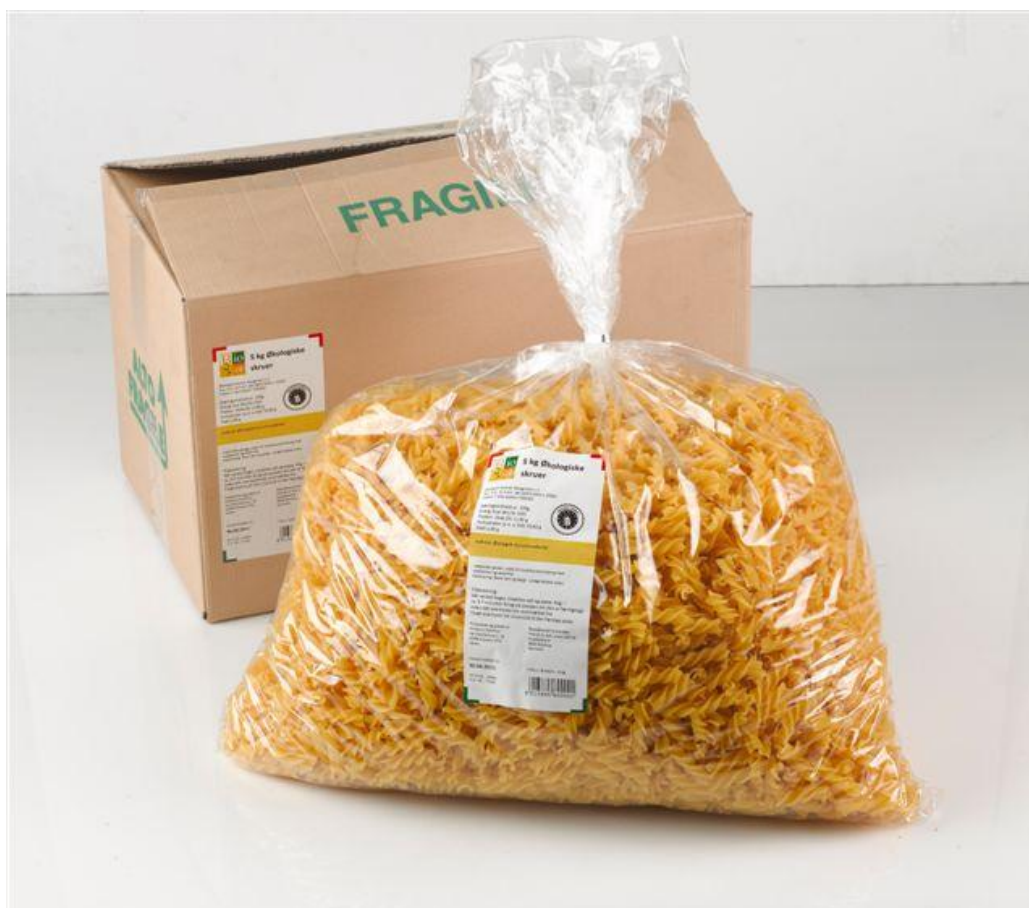
Fusilli durum (nr. 90934)