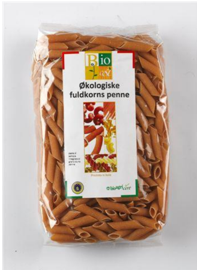
Penne fuldkorn (nr. 90937)