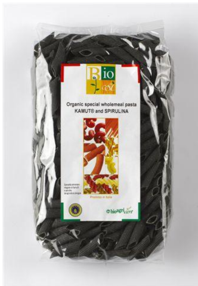
Penne fuldkorn m' kamut & spirulina (nr. 90959)