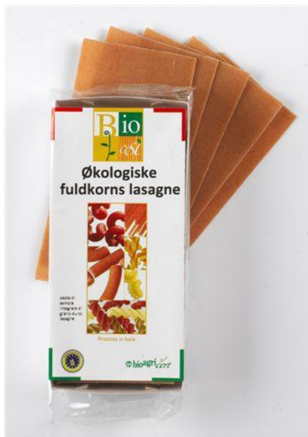
Lasagne fuldkorn 250g (nr. 90942)