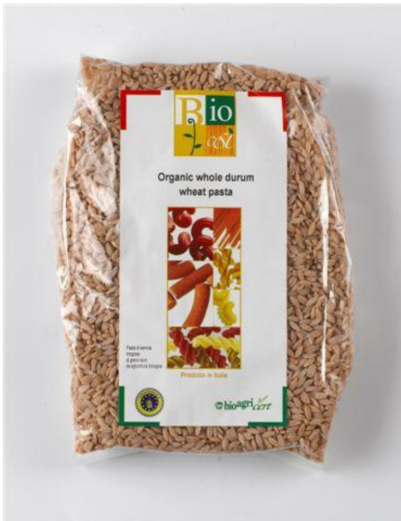
Stelline fuldkorn "ris" (nr. 90957)