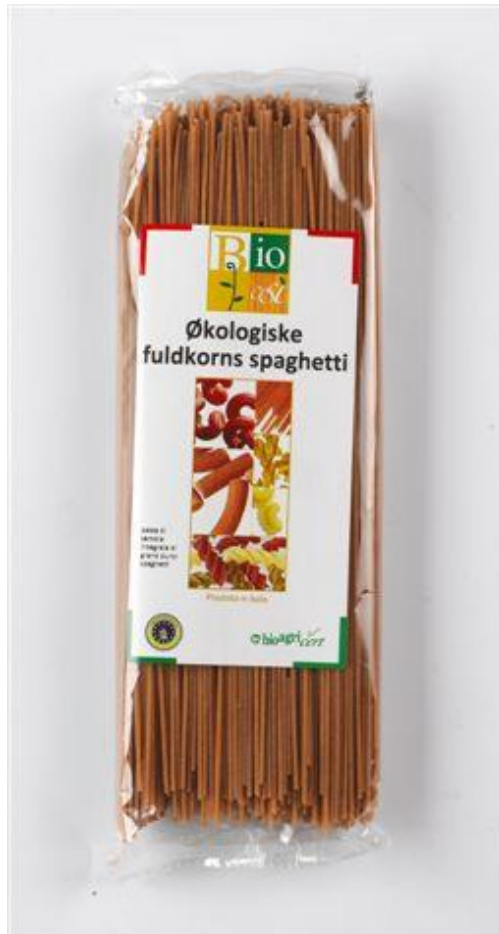
Spagetti fuldkorn (nr. 90939)