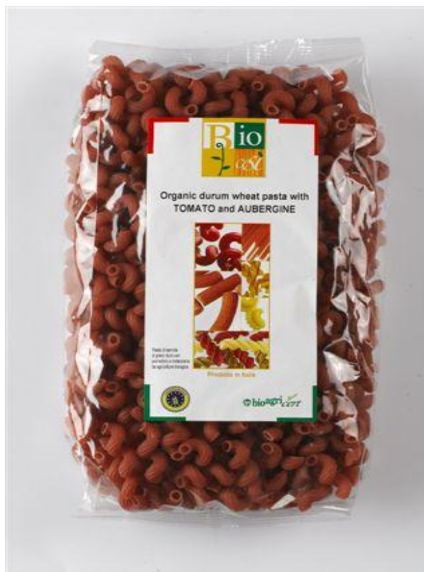
Codini durum m' tomat & aubergine (nr. 90948)