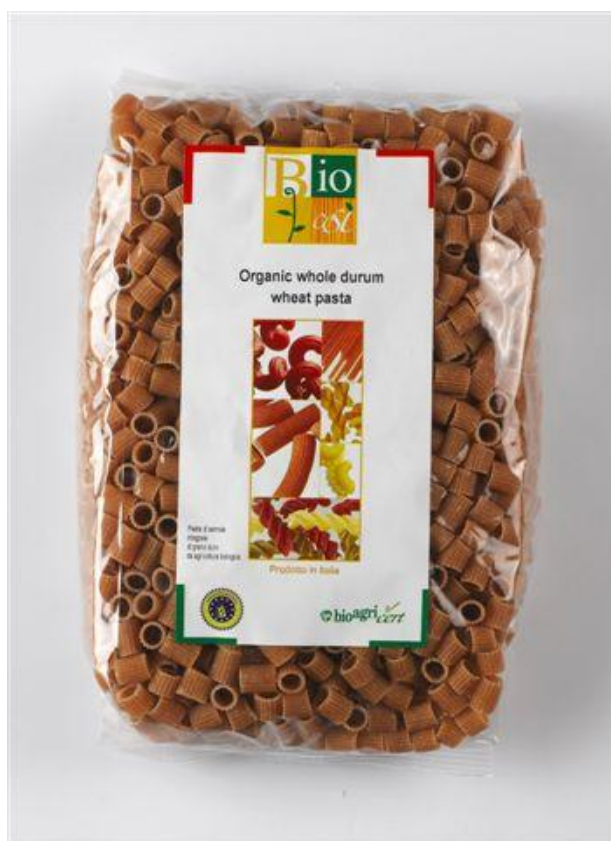
Ditalini fuldkorn (nr. 90956)