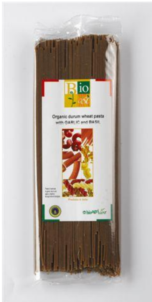
Capellini m' hvidløg & basilikum (nr. 90951)