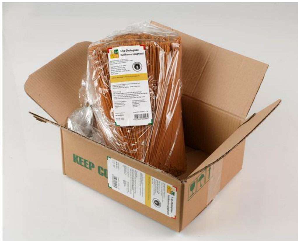
Spagetti fuldkorn (nr. 90932)