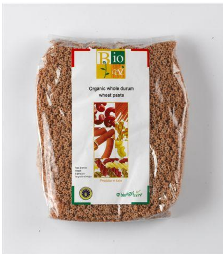
Stelline fuldkorn "stjerner" (nr. 90958)