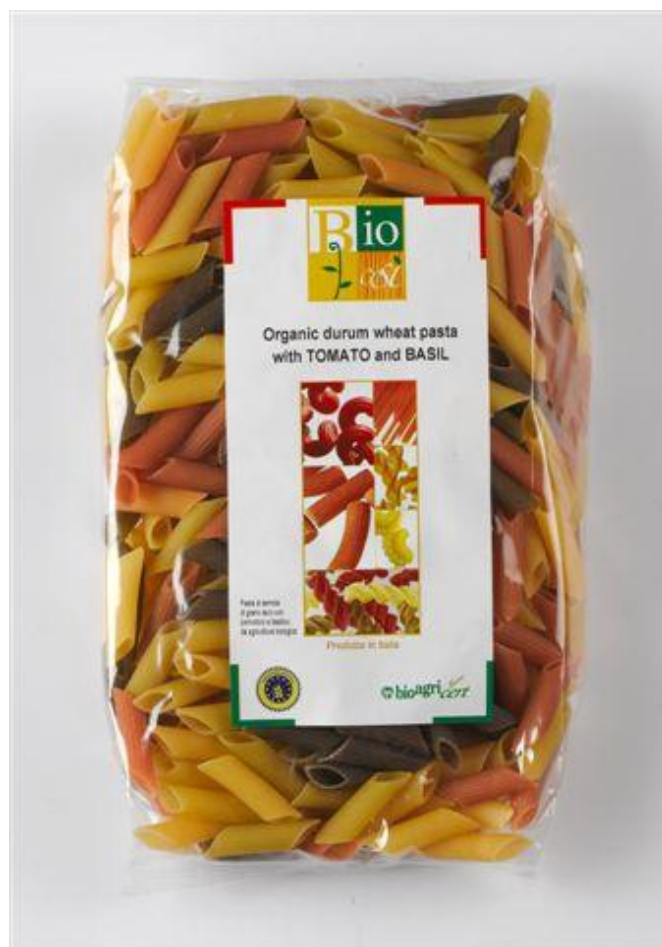
Penne durum m' tomat og basilikum (nr. 90954)