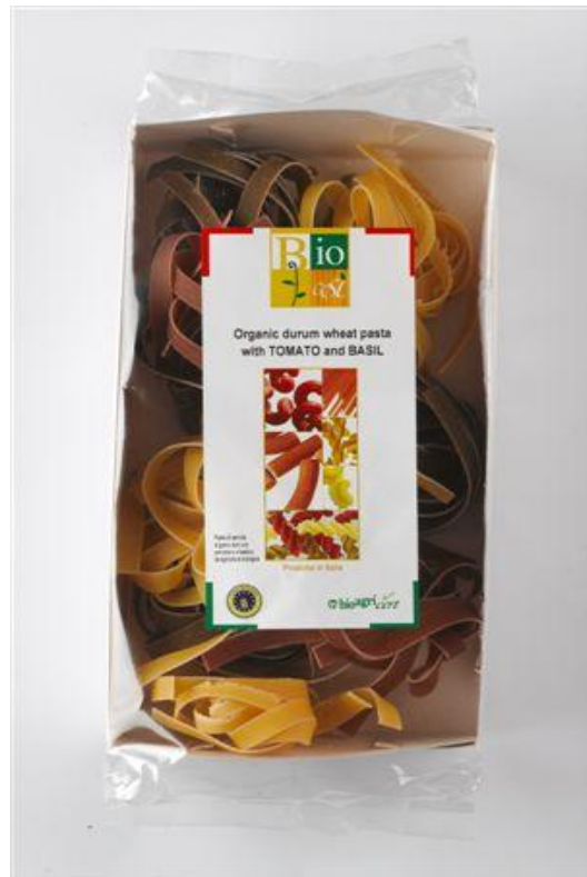
Nidi durum m' basilikum & tomat (nr. 90960)