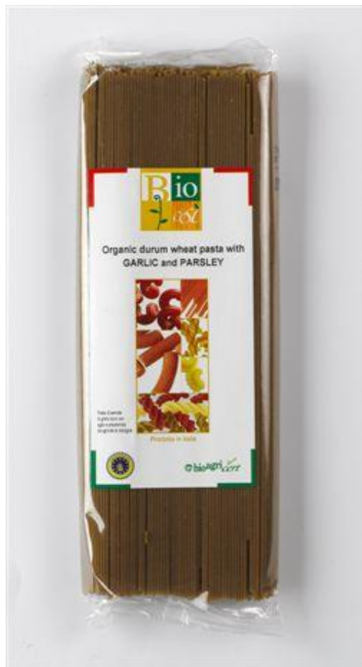
Capellini m' hvidløg & persille (nr. 90946)