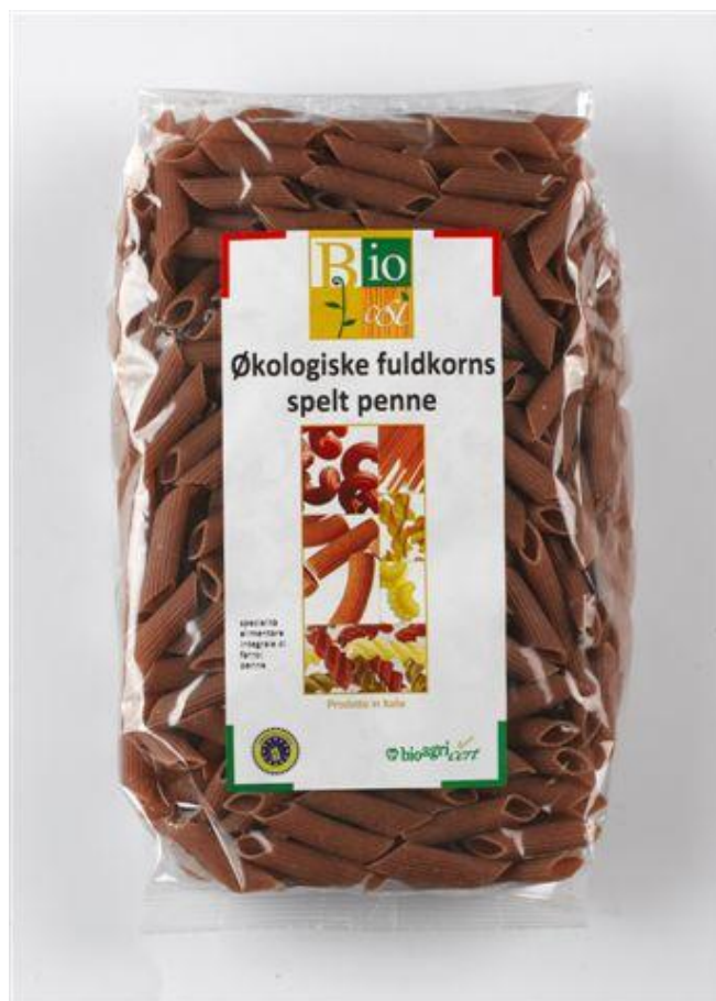
Penne fuldkorn m' spelt (nr. 90940)