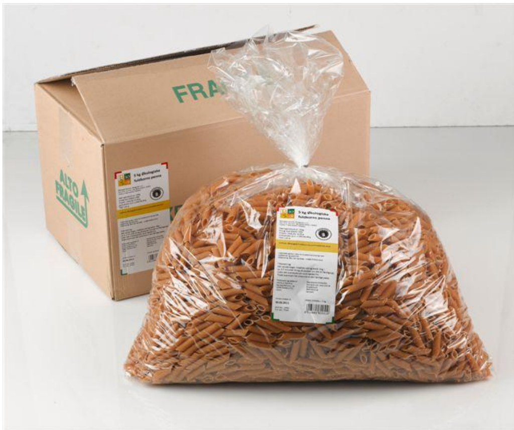
Penne fuldkorn (nr. 90931)