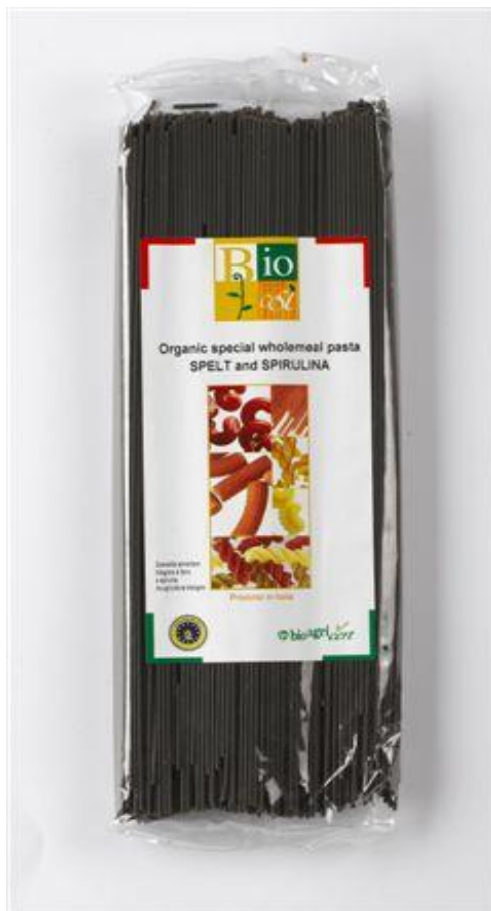
Spagetti fuldkorn m' spelt & spirulina (nr. 90947)