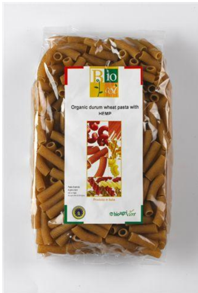
Sedani durum m' hamp (nr. 90950)