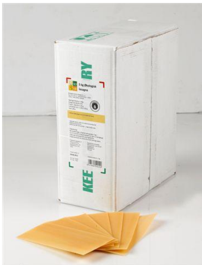
Lasagne durum (nr. 90944)