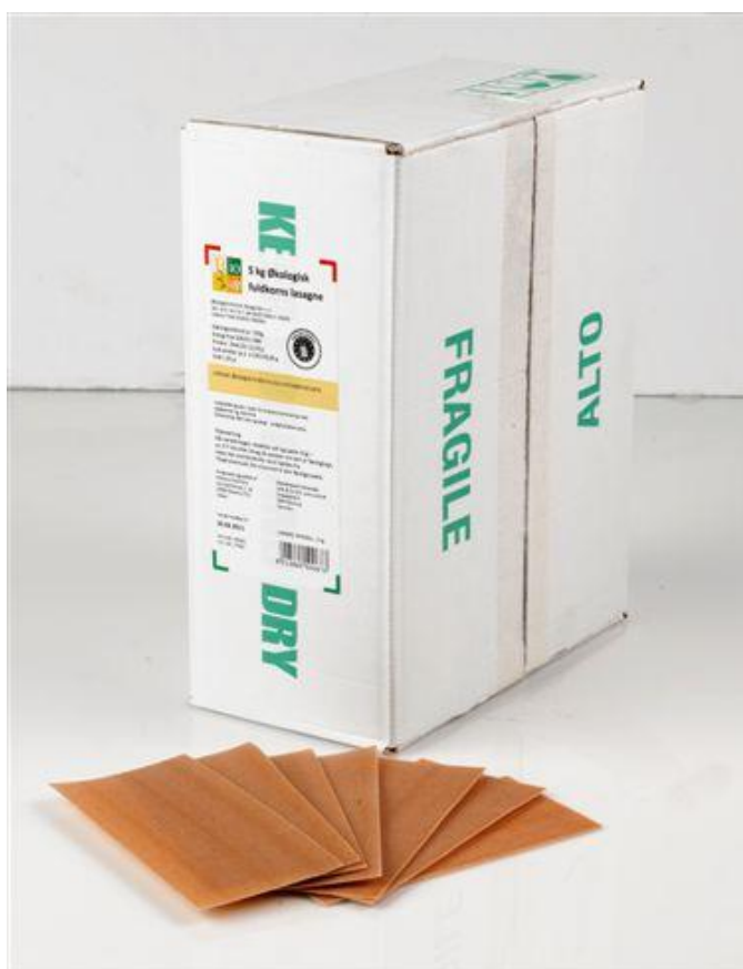
Fuldkorn lasagne 5kg (nr. 90945)