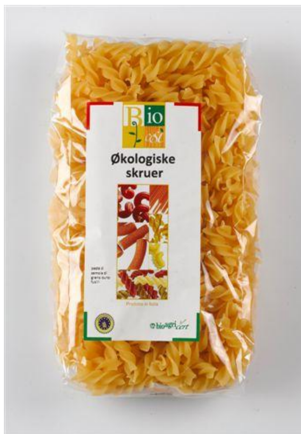
Fusilli durum (nr. 90938)