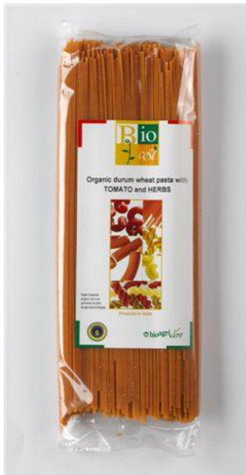
Capellini durum m' tomat & urter (nr. 90949)