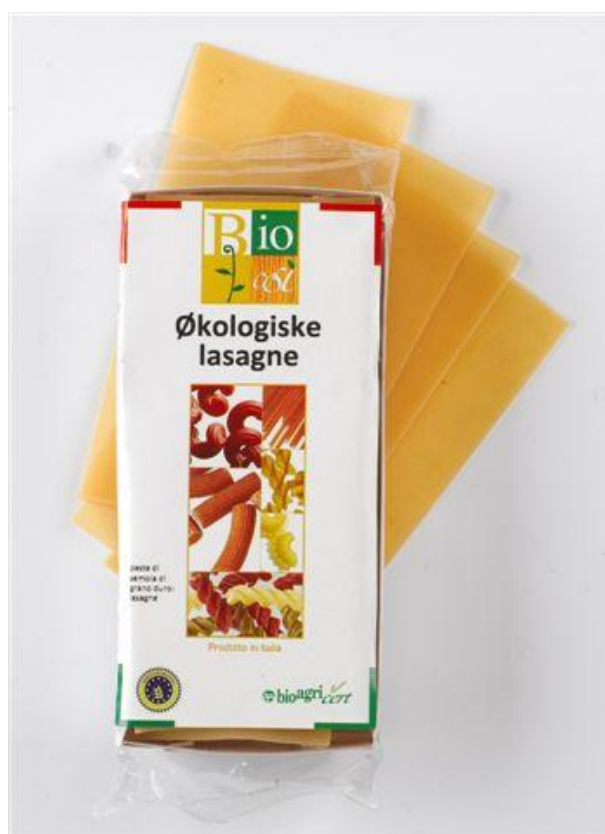
Lasagne durum 250g (nr.90943)