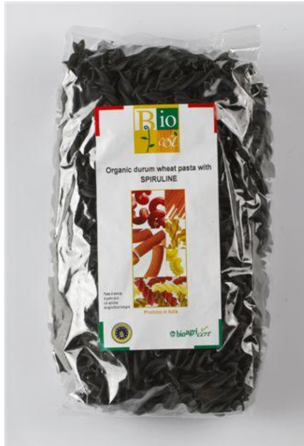
Fusilli durum m' spirulina (nr. 90953)