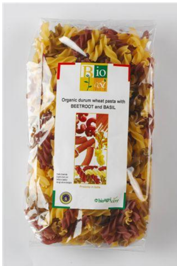
Fusilli durum m' rødbeder & basilikum (nr. 90955)