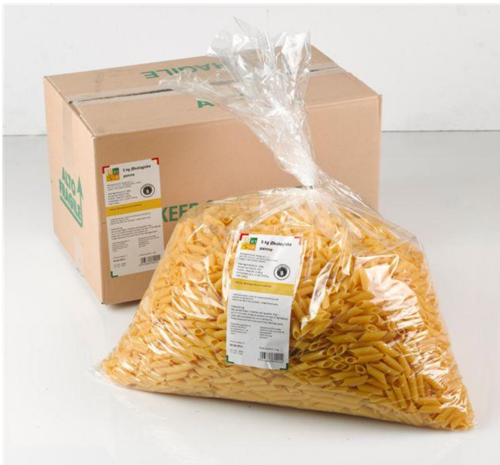
Penne durum (nr. 90933)