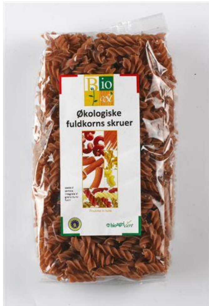
Fusilli fuldkorn (nr. 90936)