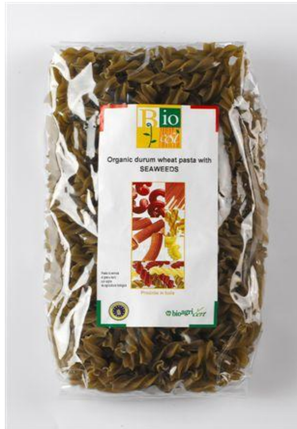
Fusilli durum m' tang (nr. 90952)